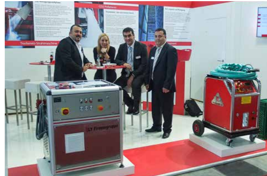
Das LY Messteam bei der parts2clean: Die Messe von 22. bis 24. Oktober verlief aus Firmensicht sehr zufriedenstellend.

Bei Messe „parts2clean“ präsentiert das Unternehmen seine Komplettangebote